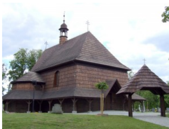
Kościół św. Anny w Czarnowasach