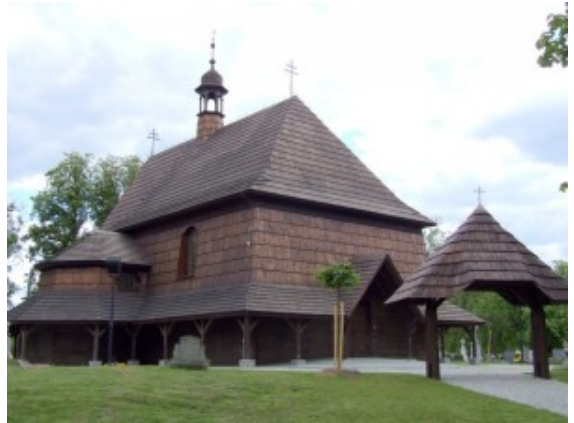
Kościół św. Anny w Czarnowasach