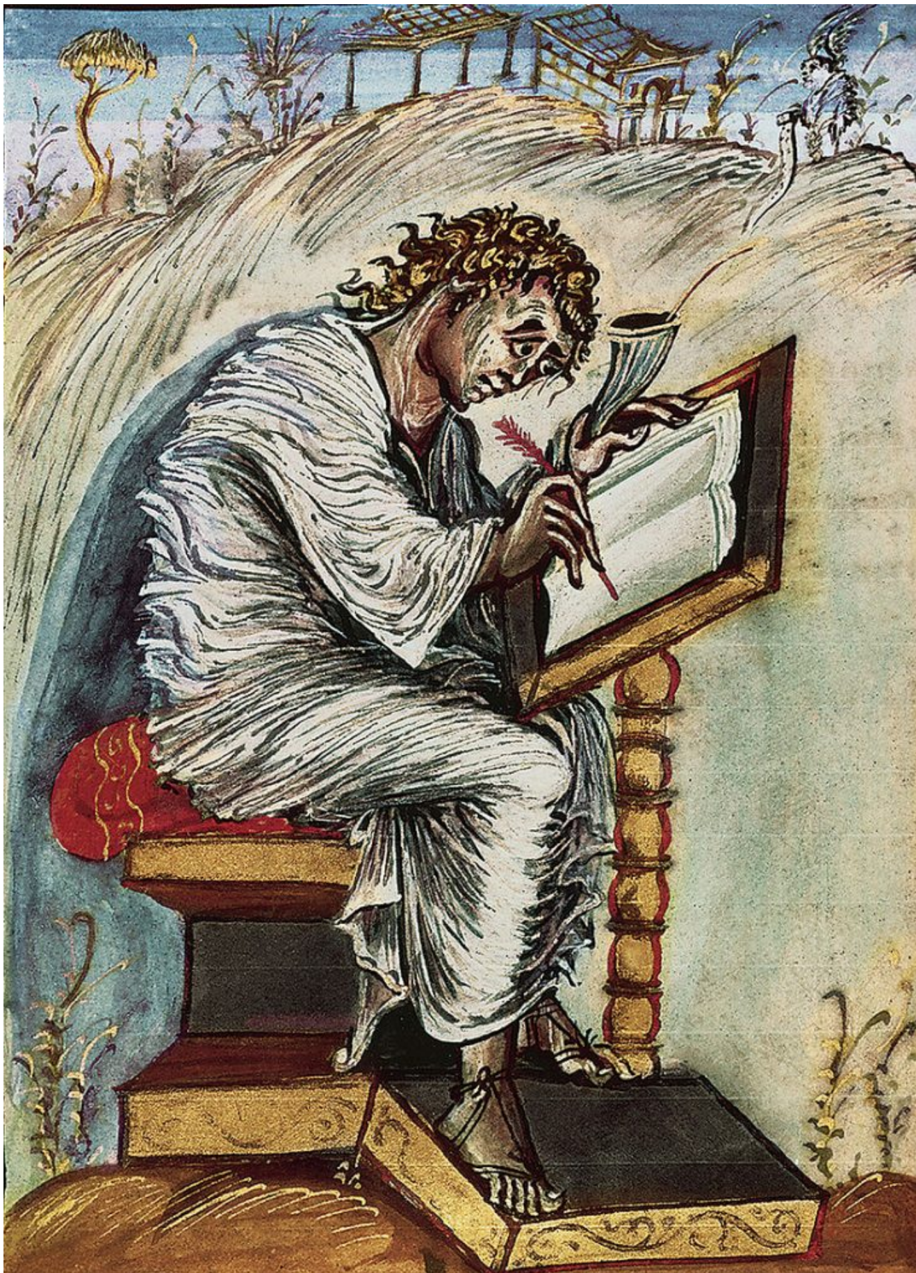
2. W poniedziałek przypada święto św. Mateusza, Apostoła i Ewangelisty.