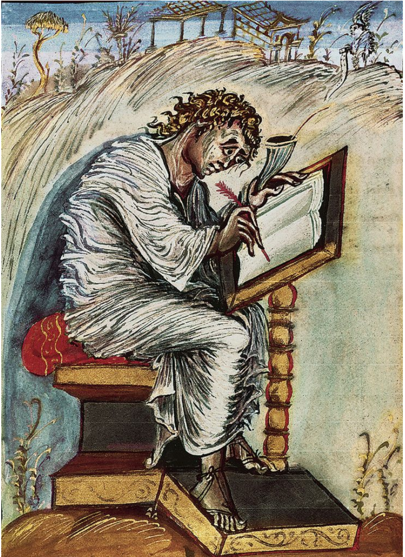
2. W poniedziałek przypada święto św. Mateusza, Apostoła i Ewangelisty.